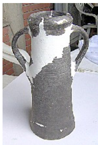
Sl. br. 1 Posuda za vodu nakon restauracije

Po nekoj logici, tom prilikom je za odbrambene potrebe i jedino moguće vodosnabdevanje utvrdjenja izgradjena i ova lagumska komunikacija. Sam proces re-vitalizacije i rekonstrukcije utvrdjenja nakon obimnijih razaranja se, na osnovu relevantnih historiografskih činjenica, bez malo, idealno uklapa u vremenski period od 525 - 535 god. n.e.