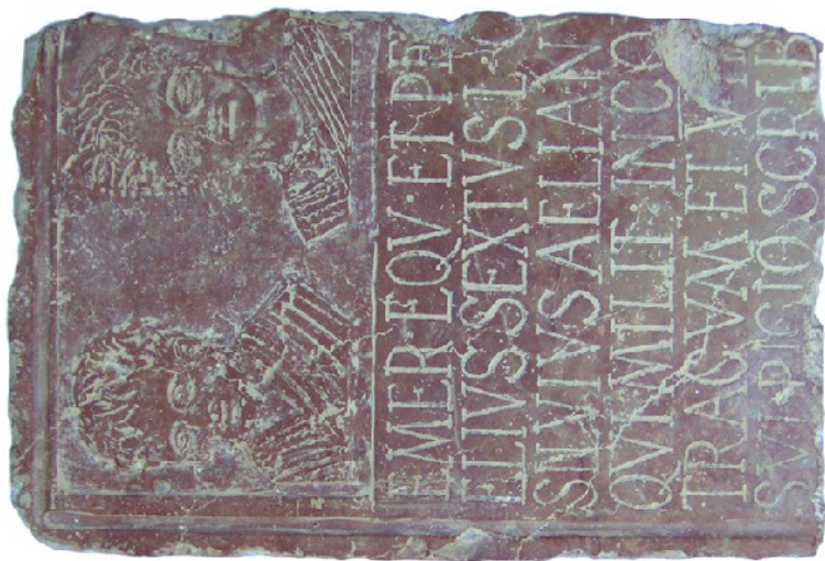
Sl. br. 1 Ulomak votivne are iz okoline antičke Eggete

Analitičko sagledavanje pojedinosti na osnovu kojih je moguća zadovoljavajuća rekonstrukcija nedostajuće form-ulacije are , nije rezultovalo nečim vanredno spektakularnim, koliko je tome doprinela srećna okolnost da je u šest-om redu pomenuto nepotpuno i delimično oštećeno ime SVLPICIO SCRIB..., odnosno, ime carskog namesnika provincije Germanija (P.SVLPICIO SCRIBONIO PROCVLO), ličnosti koja je imala zapaženu ulogu za vladavine zloglasnog cara Nerona (54-68 god. n. e. – NERO CLAVDIVS CAESAR AVGVSTVS GERMANICVS). Istovremeno, ali ne i pre-sudno, na vremenski period iz koga potiče ovaj ulomak are ukazuju gentilne karakteristike imena iz drugog i trećeg reda. Nepotpuno ime L. C..., uz poznate činjenice o legionarima i njihovom etničkom poreklu, inicira na mogućnost da se odnosi na izvesnog Lucia, verovatno poreklom Breuca, jer je ovo ime bilo vrlo često među panonskim Breucima (čak i Amantinima), koji su kao peregrini uzimali masovno i po hrabrosti zapaženo učešće u rimskoj legiji. Istoriografija ovog perioda beleži da je ovo Breucima omiljeno ime prenošeno nasledno u dve do tri generacije.