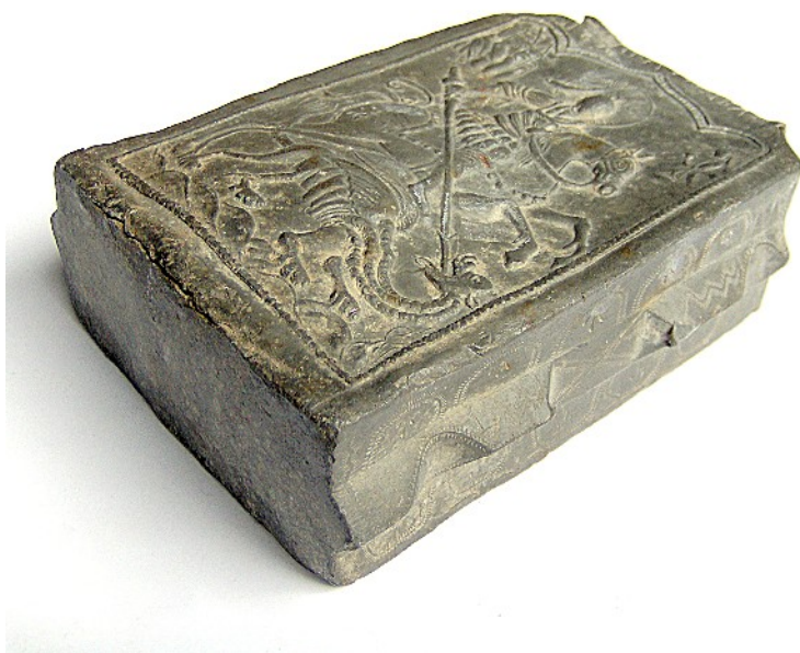
Sl. br. 3 Vojnička čaturica iz prvog srpskog ustanka