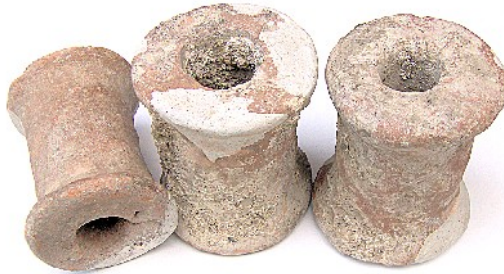
Sl. br. 4 Keramički vodovodno-kanalizacioni segmenti

U ostatku zida jednog od objekata unutar drugog (unutrašnjeg) odbrambenog bedema utvrdjenja Bederiana, nakon rušilačkih pretraga tragača za zlatom i antikvitetima našao sam tri vodovodno-kanalizaciona članka (Sl. br. 4) i uočio znatniji broj ulomaka veće keramičke posude ( pitos, cadus, culeus ) sa svežim prelomima, koji, očito, nisu bili predmet njihovog interesovanja.