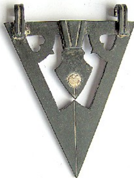
Sl. br. 1 Vizantijski nivelir (izgled nakon izvršene restauracije).

Radi kompletiranja artefakta u svrhu sagledavanja njego-vog izgleda replicirano je klatno (visak) i opterećeno ugra-djenim komadom olova, poput u litraturi opisanih i prikazanih primeraka. Čineći ga funkcionalnijim, olovni teg, faktički, značajno poboljšava njegovu praktičnu primenu.