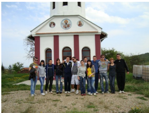
Fanovi iz Gornjeg Brijanja