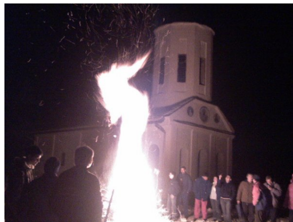
Paljenje vatre ispred crkve