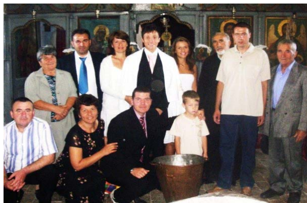
Krštenje u Konaku