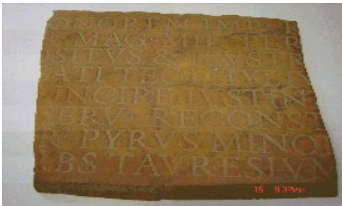
visina pisma 1,25 digitus-a

Na slici 2 je prikazan ulomak tabule dimenzije 275 x 255 mm, debljine između 16 i 19 mm, sa 8 reda neuobičajeno kvalitetne majuskule rimske kapitale pismovne visine 23 mm. Obzirom na imponantnu perfekciju u smislu kvaliteta i kontinuiteta klesanja pismovnih simbola i zanemarljivo malo uočljivih nadostataka, lično verujem da nije delo lokalnih majstora, već da potiče iz neke renomirane radionice imperije. Artefakt je sa rano-vizantijskog lokaliteta „Kale” ( Pyrvs minorvm ) u ataru Gornjeg Brijanja.