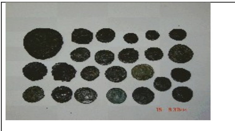
Slika 5 prikazuje deo pronadjenog novca na rano-vizantijskom lokalitetu „Kale” ( Pyrvs minorvm ) u ataru sela Gornjeg Brijanja.